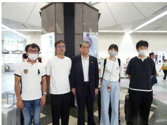
(井上会長と派遣される職員 4 名)

9月5日（木）経営協会員法人より4名が、福祉避難所「第二金沢朱鷺の苑（石川県金沢市）」に出発しました。