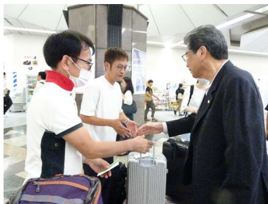
(井上会長より派遣される職員へ激励)